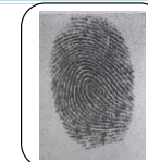
Huella Índice Derecho